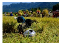
入選「爽りの秋みんなで稲刈り」