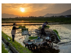
入選「夫婦で共同作業」