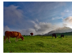
入選「のんびりと草をはむ」

主催：富士フィルムマテリアルマニュファクチャリング(株) 南阿蘇村環境保全農業推進協議会